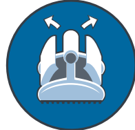
Filtreye üstten ulaşım