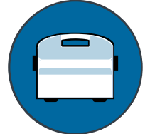
Güç ünitesinde gösterge