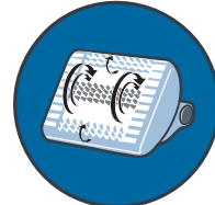
Ekstra aktif fırça